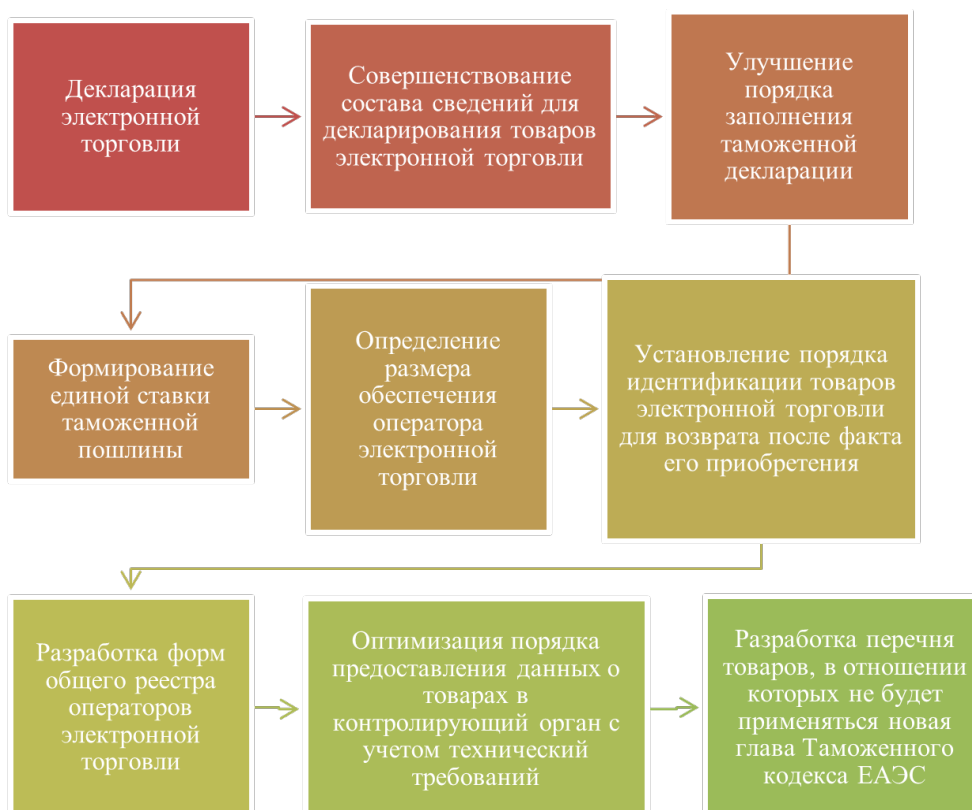
Рис. 4 / Fig. 4. Механизм совершенствования регулирования трансграничной электронной торговли при принятии новых нормативно-правовых актов ЕЭК [9] / The mechanism for improving the regulation of cross-border electronic commerce in the adoption of new regulatory legal acts of the EEC [9]