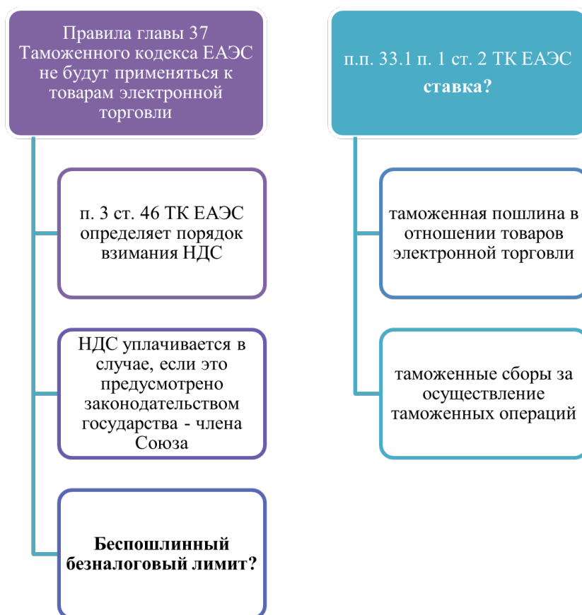
Рис. 3 / Fig. 3. Вопросы, требующие решения в сфере таможенного регулирования стран – участниц ЕАЭС [9] / Issues requiring solutions in the field of customs regulation of the EAEU member states [9]